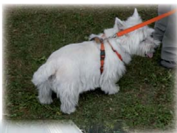
Bunt gemischtes ...