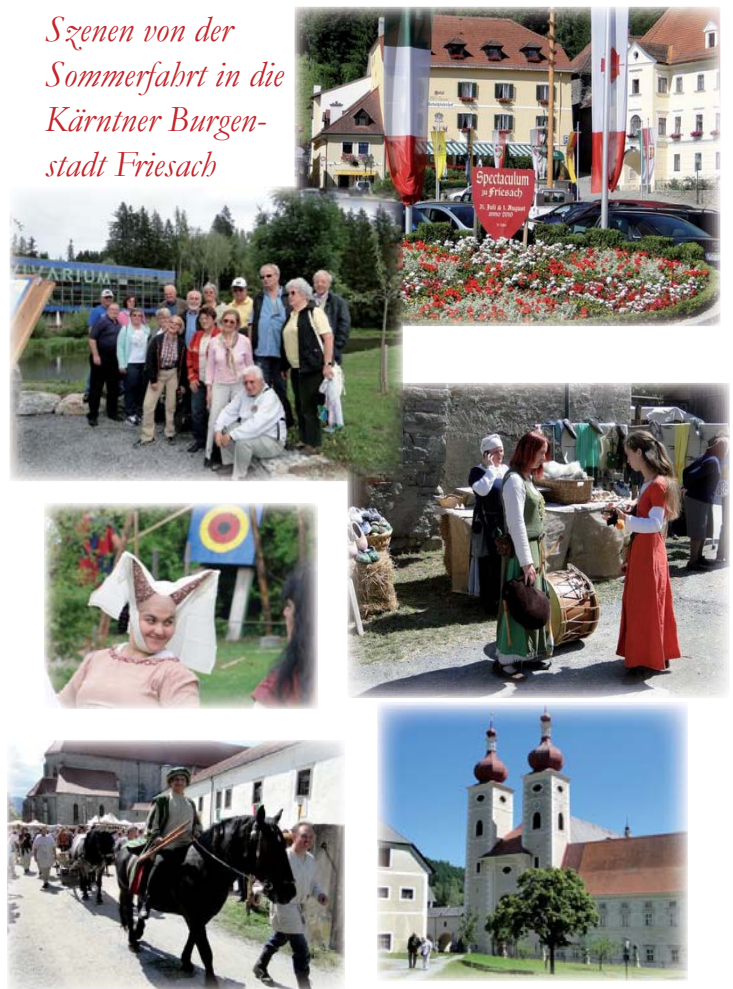
Szenen von der Sommerfahrt in die Kärntner Burgen- stadt Friesach

von Schloß Straßburg und des Benediktinerstiftes St. Lambrecht fanden ebenso großen Anklang wie die geselligen Runden bei guten Gastronomen.